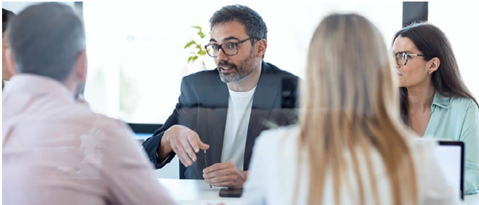
Verhandlungsphase: Die Inhalte einer möglichen Zusammenarbeit müssen im Detail besprochen werden, ohne dabei kommerziell hochsensible Daten direkt auszutauschen.

Wer eine Einkaufskooperation gründet, kann Einkaufspreise senken und so die Profitabilität steigern. Einkaufskooperationen sind daher eine beliebte strategische Option für Unternehmen, auch in Krisenzeiten. In einer vierteiligen Serie stellt Dr. Reto Batzel die Aufgaben vor, die bei der Gründung einer Einkaufskooperation typischerweise von den Unternehmensfunktionen Recht und Compliance übernommen werden. Dieser 2. Teil der Serie beschäftigt sich mit der Verhandlungsphase.